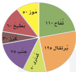
الفاكهة المفضلة لطلاب المدرسة