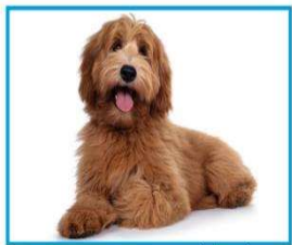
▲ المخلوقات الحية المصابة ناقلة للأمراض.