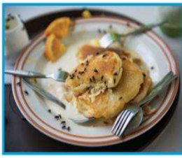
▲ الطعام و الشراب المكشوف مسبب للأمراض.