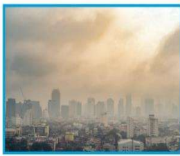
▲ الهواء الملوّث ناقل للأمراض.

○ العدوى : هي انتقال المرض من المخلوق الحي المصاب الى المخلوق الحي السليم .