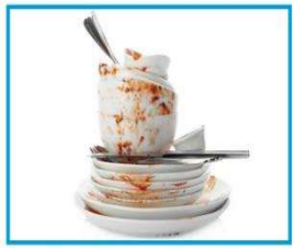
▲ استعمال الأدوات الملوثة ناقلة للأمراض.