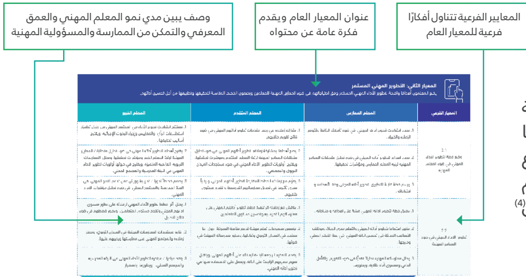
الشكل رقم (3) وصف مكونات المعايير المهنية للمعلمين

ويمثل الشكل رقم (3) وصفًا لمكونات المعايير المهنية التربوية للمعلمين