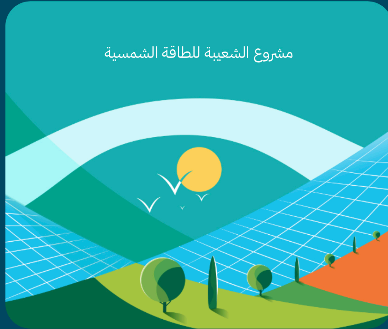
مشروع الشعبية للطاقة الشمسية

يعد أحد مشاريع الطاقة المتجددة التابعة لوزارة الطاقة، وسجلت أقل تكلفة لشراء الكهرباء المنتجة من الطاقة الشمسية في العالم، حيث بلغت 1.04 سنت أميركي لكل كيلووات بالساعة.