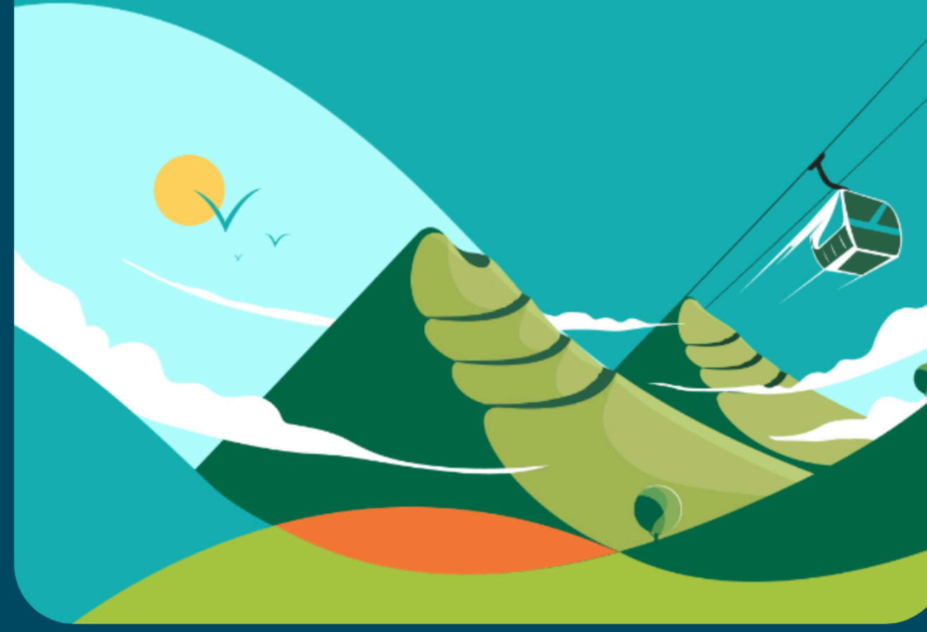
مشروع السودة للتطوير

وجهة جبلية سياحية فاخرة في أعلى قمة في المملكة العربية السعودية بارتفاع يصل إلى 3015 متر عن سطح البحر، حيث تهدف لجذب 2 مليون زائر سنوياً على مدار العام، وتقديم تجربة ثقافية وتراثية.