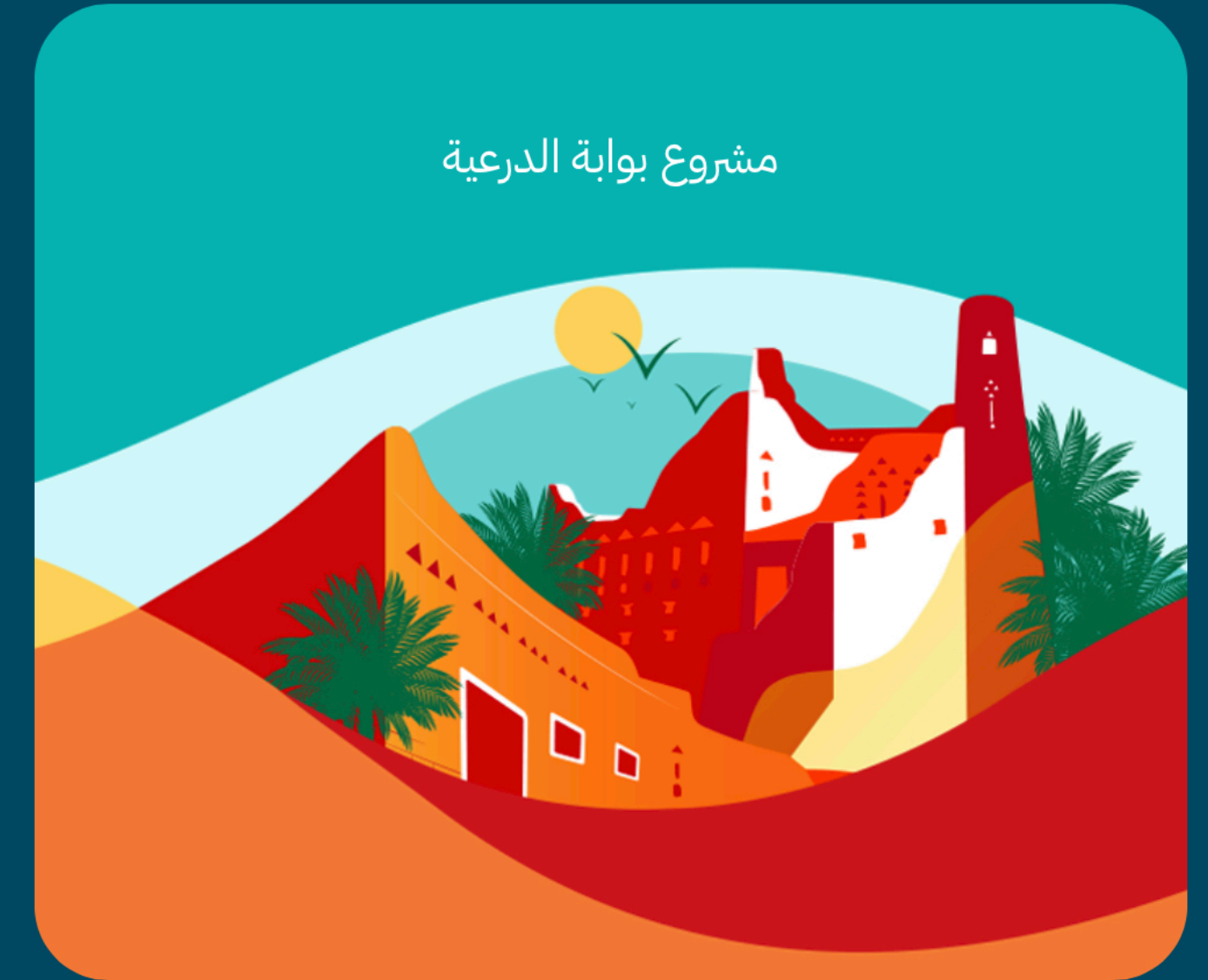
مشروع بوابة الدرعية

الدرعية هي الموطن الأول للعائلة الحاكمة ومهد انطلاق الدولة السعودية؛ لذا بدأ التطوير فيها لإبراز إرثها التاريخي وأصالتها العريقة من خلال مشاريعها التطويرية لتكن أكبر مدينة ثقافية وتراثية ووجهة سياحية للعالم.