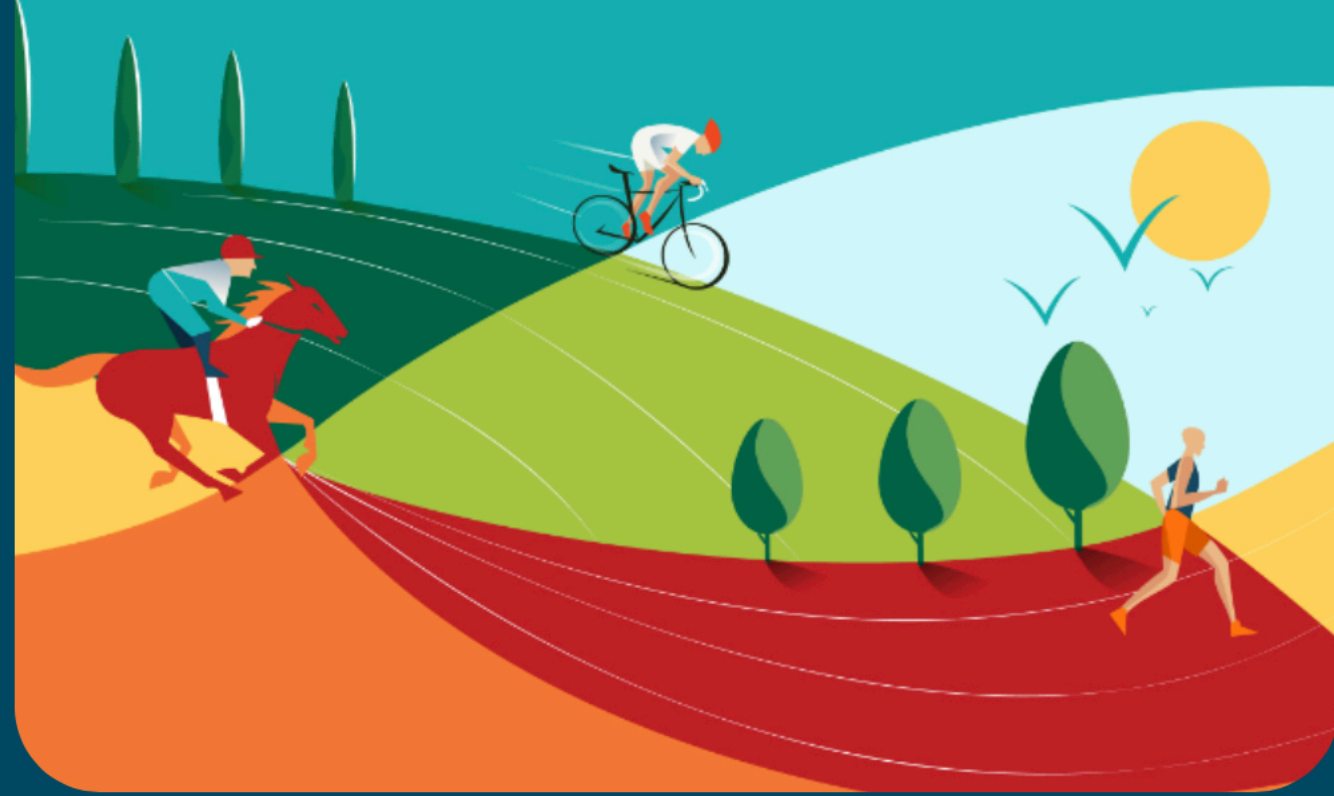
مشروع المسار الرياضي

يعد أكبر منتزه طولي في العالم وأحد أكبر مشاريع التطوير الحضري في مدينة الرياض، ويهدف إلى تعزيز ثقافة نمط الحياة الصحية في التنقل وتحفيز الناس على ممارسة مختلف الرياضات كالمشي وركوب الدراجات الهوائية والخيول.