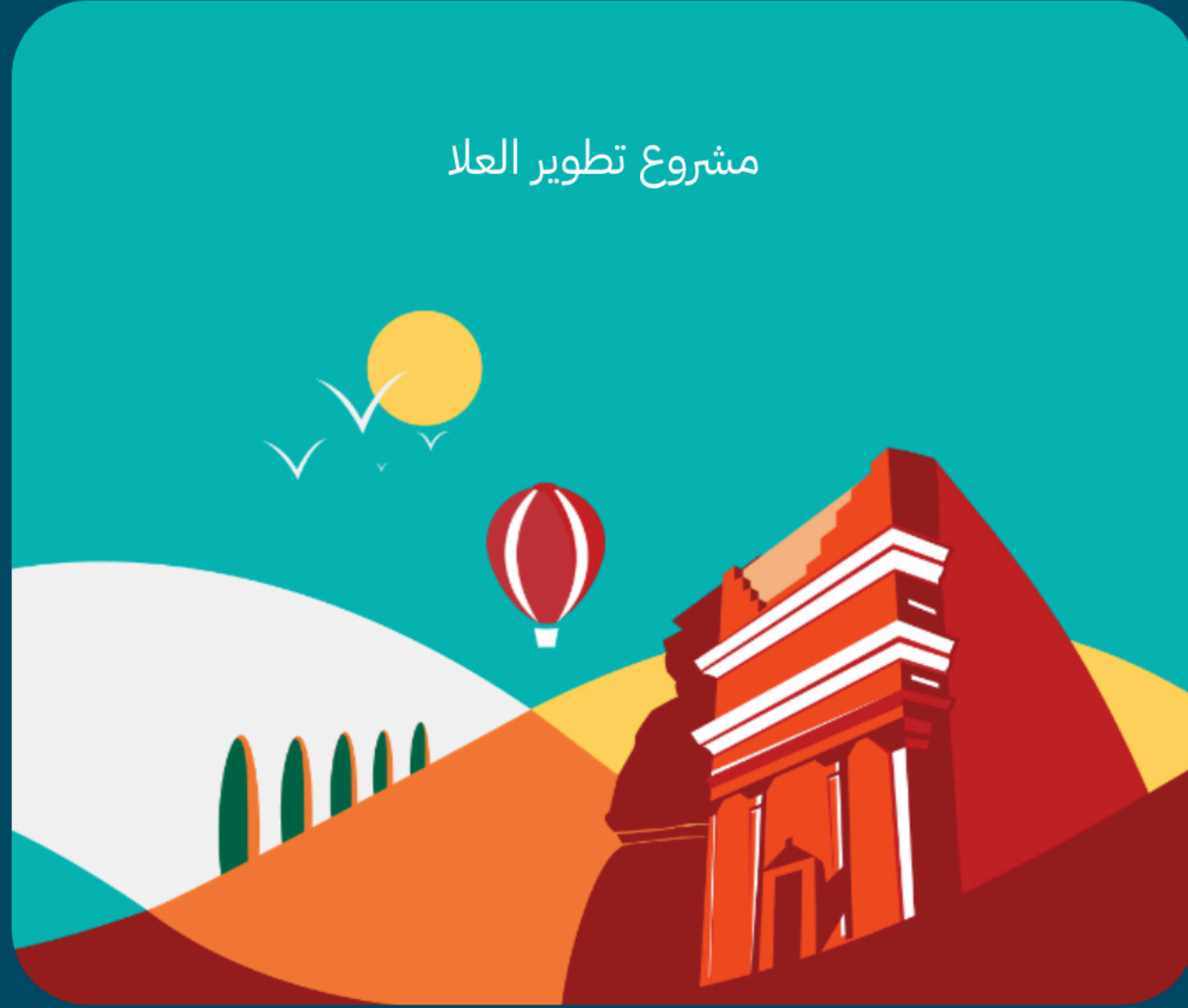
مشروع تطوير العلا

تقع في شمال غرب المملكة وتعد مرآة للحضارات، يتجاوز عمرها 200 ألف عام، ضمن كيان مكاني يحمل تاريخاً بشواهد حية، وأصول ثقافية وإبداع بشري من عمق التاريخ. كانت ولا تزال مقصداً للرحالة والمستكشفين.