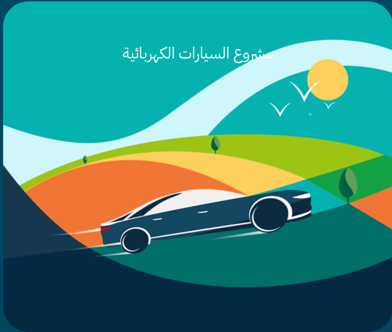
مشروع السيارات الكهربائية

تماشياً مع رؤية ٢٠٣٠ ونحو أفق جديد من التطور، تم إنشاء شركة (سير)، كأول علامة تجارية سعودية لتصنيع السيارات الكهربائية في السعودية. ويأتي إطلاق الشركة تماشياً مع استراتيجية تمكين القطاعات الواعدة لتتوسع مصادر الإقتصاد السعودي.