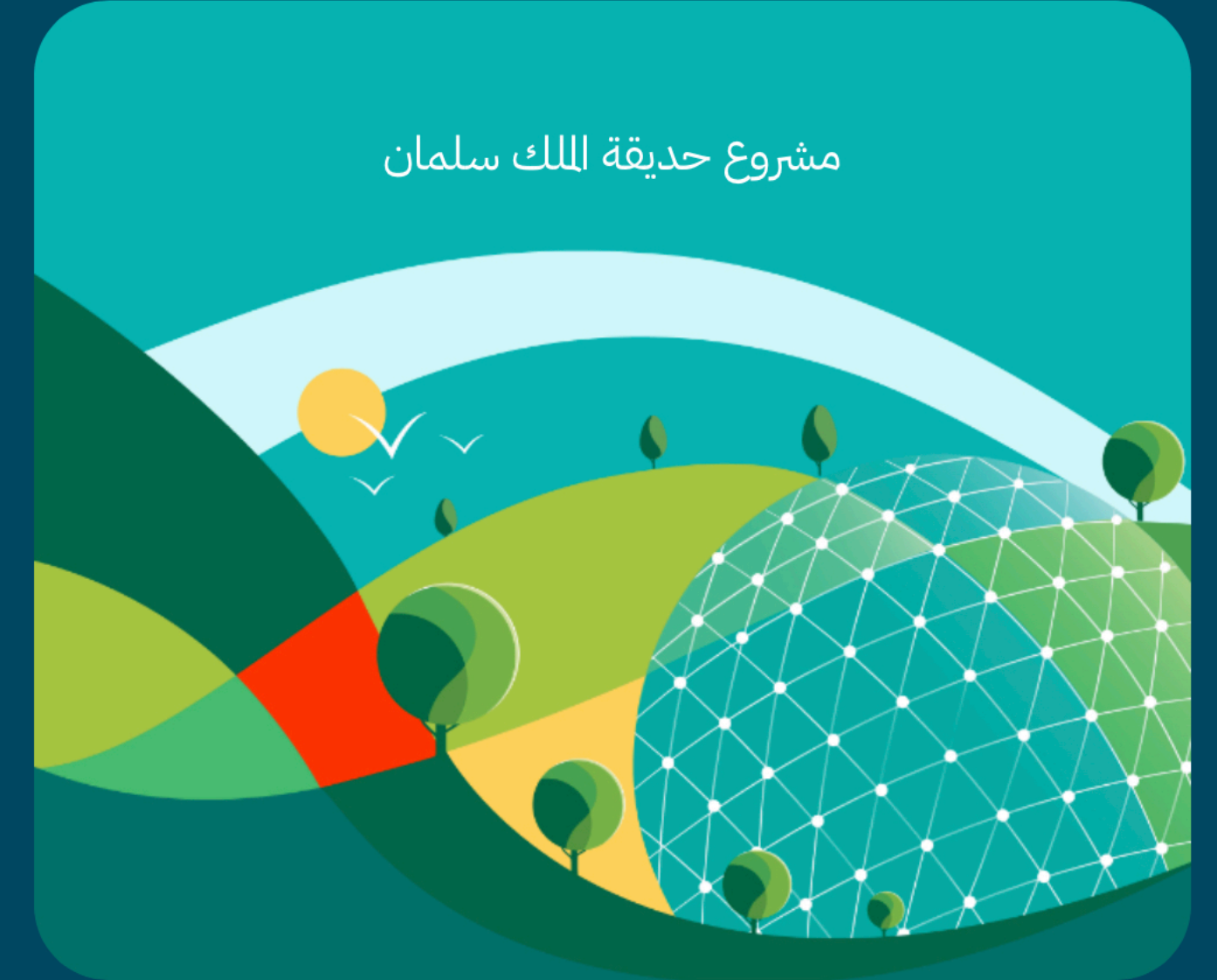
مشروع حديقة الملك سلمان

إحدى أكبر الحدائق الحضرية حول العالم، بمساحتها الرحبة، وبيئتها الحيوية، وأنشطتها اللامحدودة، ستحقق الحديقة تنمية الغطاء النباتي وتعزيز تصنيف مدينة الرياض للارتقاء بجودة حياة سكانها وتقديم تجربة استثنائية لزوارها.